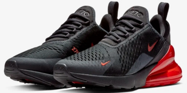
پرفروش ترین کفش های دیجی کالا برای مدت محدود