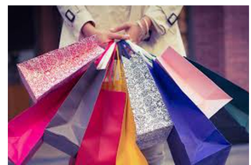
بهترین زمان خرید در استانبول