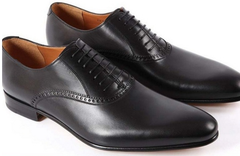
کفش پرفروش بامیلو فقط با ۸۴ هزار تومان در بامیلو