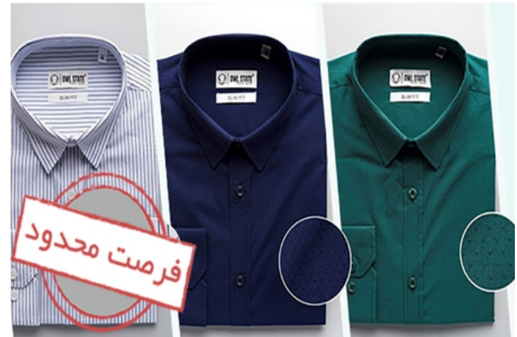
بهترین های بامیلو زیر قیمت بازار حراج شد!!