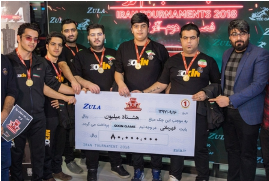
برندگان این ماه زولا جوایز نقدی خود را دریافت کردند.