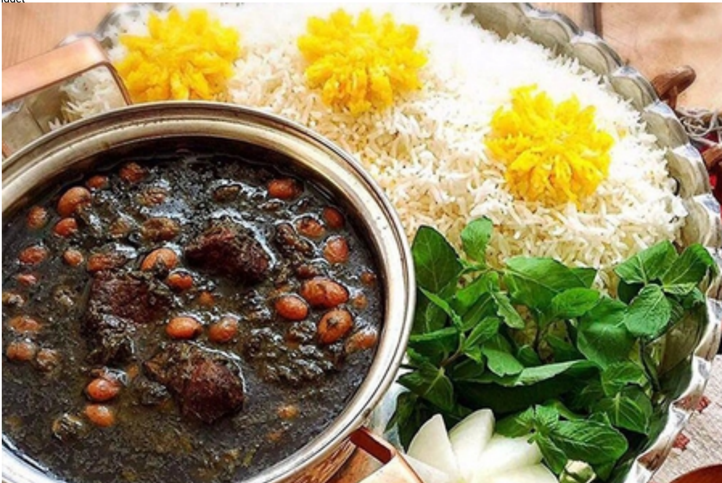
چطور دوشنبه‌ها هزینه کمتری برای سفارش غذا داشته باشیم