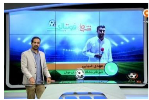
سیلی زدن علی دایی به خبرنگار باشگاه خبرنگاران