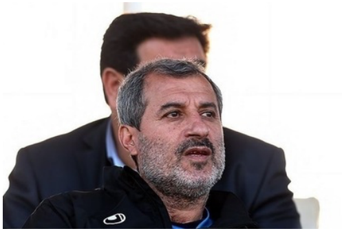
مایلی کهن: به خاطر صعود پرسپولیس به کی روش تسلیت می گویم!