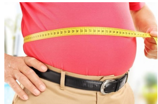
۷ خوراکی شگفت انگیز برای آب کردن شکم و پهلو