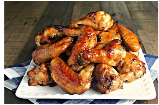
فوت و فن های تهیه بال مرغ متفاوت!