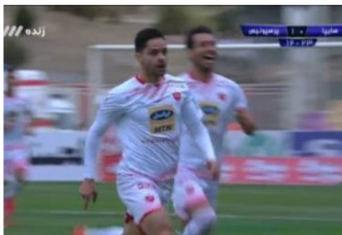
گل اول پرسپولیس به سایپا (سوپر گل کامیابی نیا)