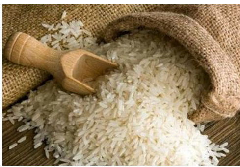
خرید آنلاین برنج مرغوب ایرانی و تحویل در روز!