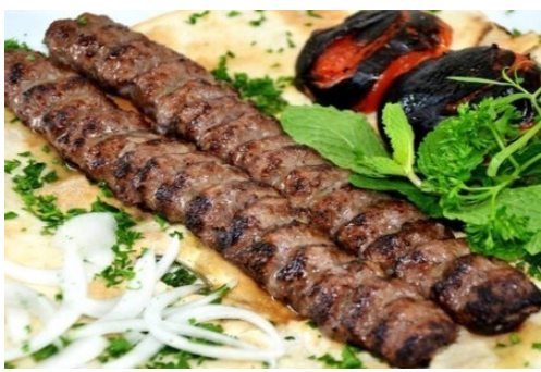
چگونه بهترین کباب کوبیده رو درست کنیم؟