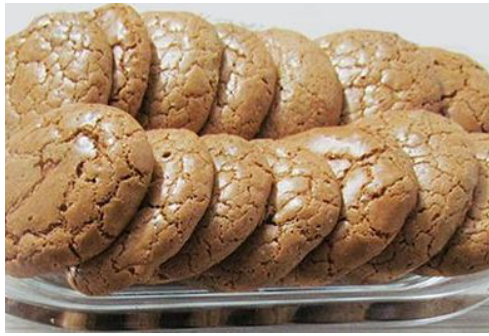
آموزش طرز تهیه شیرینی گردویی خوشمزه در کمترین زمان