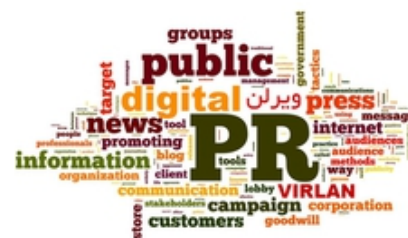
بهترین راهکار برای افزایش فروش چیست ؟