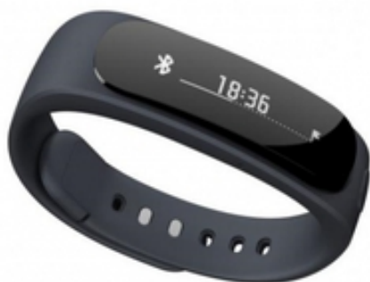
حراج شگفت انگیز بامیلو تا ۸۵٪ حراج ویژه آخر هفته