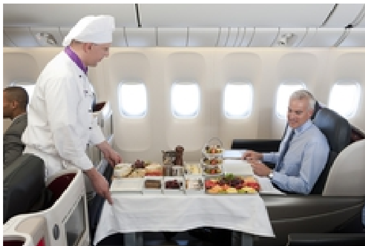
قیمت بلیط بیزینس کلاس به استانبول چقدر است؟ از سایت الی گشت ببینید