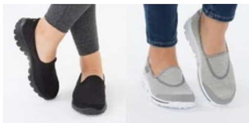
کفش های زنانه اسکچرز با تخفیف ویژه در دیجی کالا