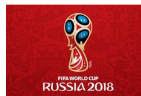
تور روسیه جام جهانی 2018