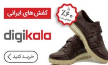
کفش ایرانی تا ۶۰ درصد تخفیف ویژه در دیجی کالا