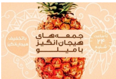
خرید هیجان انگیز جمعه با تخفیف ۸۵٪