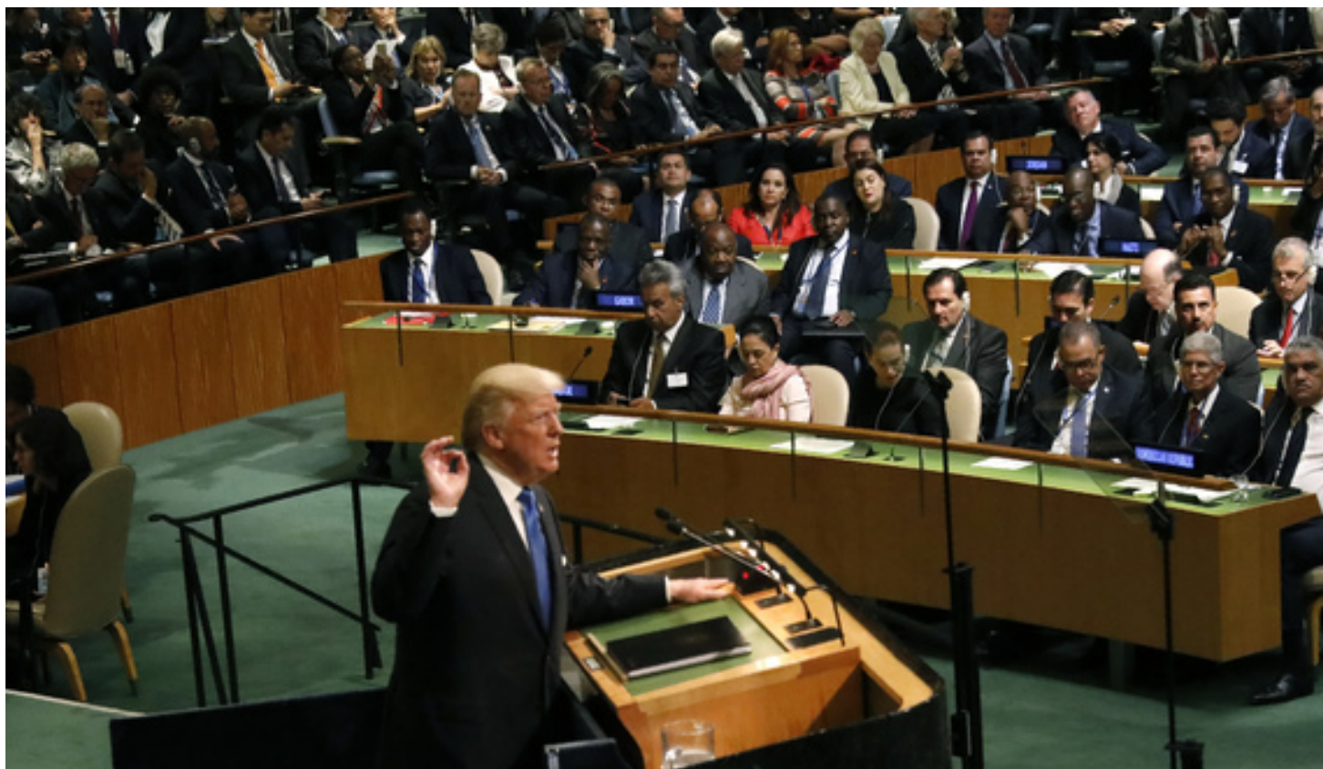
حملات ترامپ به حکومت ایران در سازمان ملل