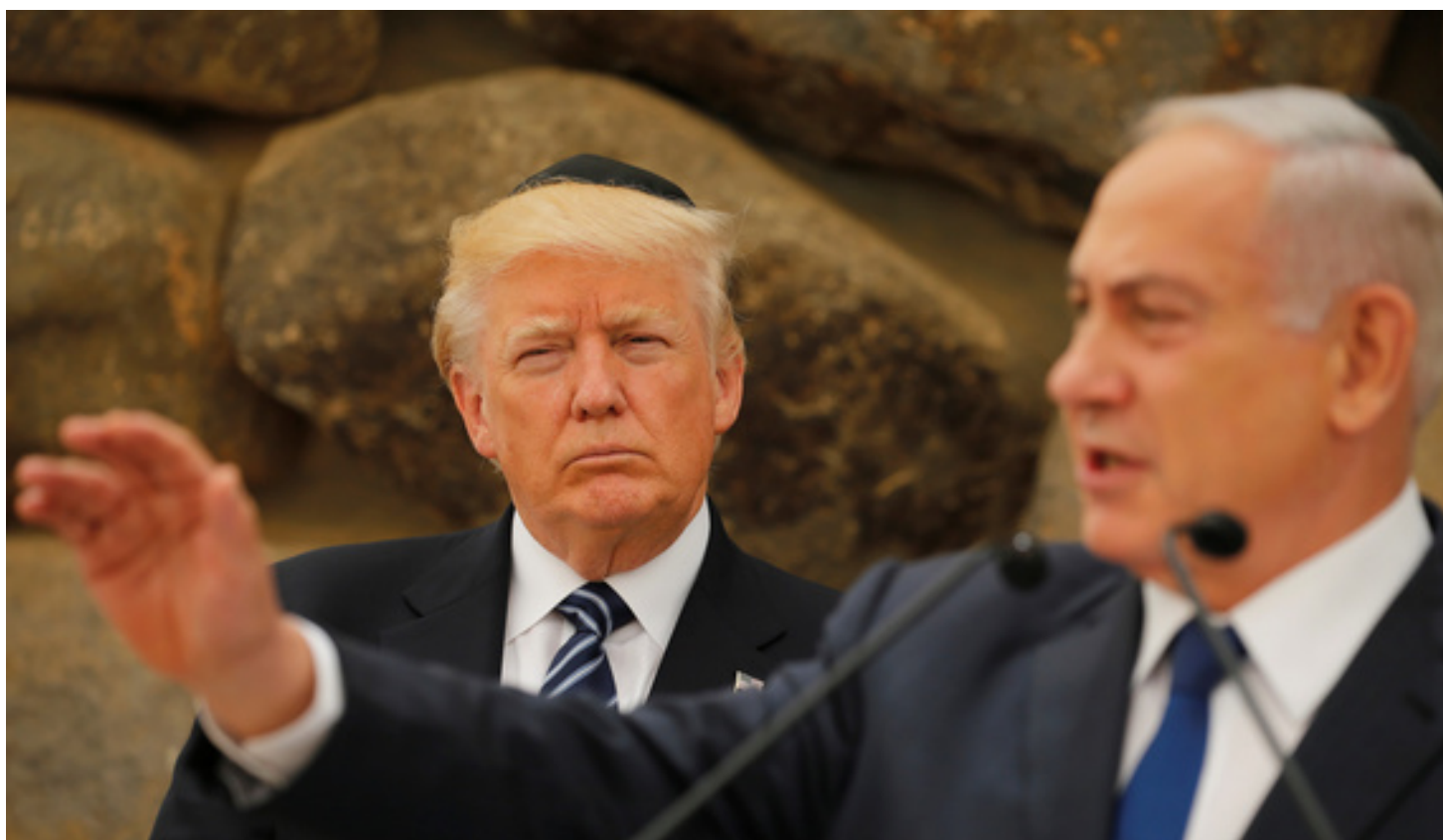
در مخالفت با برنامه هسته‌ای ایران، ترامپ و نتانیاهو با خطر تنها ماندن مواجه هستند