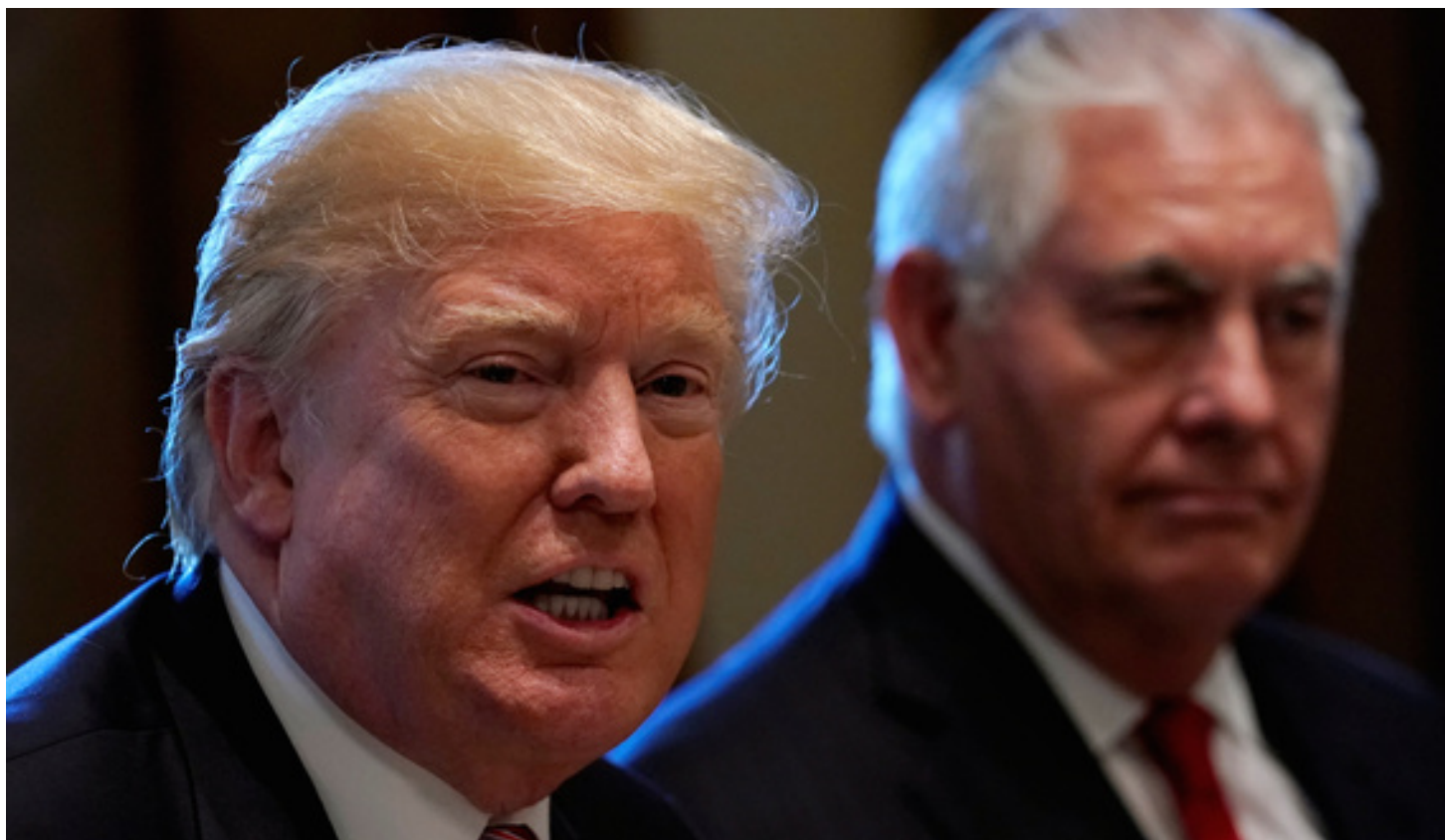
آمریکا هنوز تصمیم نهایی را درباره برجام اتخاذ نکرده است