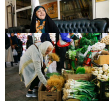
گزارش تصویری دیده بان ایران از بازار شب عید

آلودگی در دریای خزر به مرز هشداررسیده است؛ جمهوری آذربایجان همکاری نمی کند/آبگیری سد گتوند سیاسی بود/ سد گتوند در خوزستان فاجعه زیست محیطی پدید آورده است