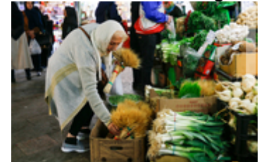
گزارش تصویری دیده بان ایران از بازار شب عید