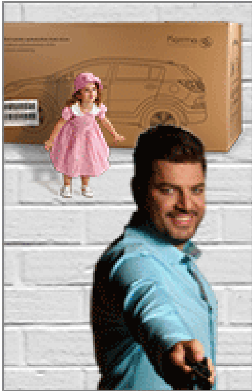
( http://fararu.com/fa/ads/redirect/a/1076 )