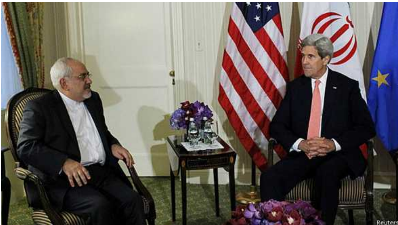
وزرای خارجه آمریکا و ایران در یک سال گذشته بارها با هم ملاقات کرده اند

برای بیشتر حرف‌های او مستندات و شواهد کافی وجود دارد. اگر خواننده در جاهایی احساس می کند که همه داستان به او گفته نمی‌شود، برای آنهم توضیح قابل قبولی وجود دارد: کسانی که در بطن دولت کار کرده اند، که موسویان هم یکی از آنهاست، ناگزیرند همانطور زمانی که یکی از وزرای بریتانیایی گفته، در گفتن برخی حقایق "امساک" کنند.