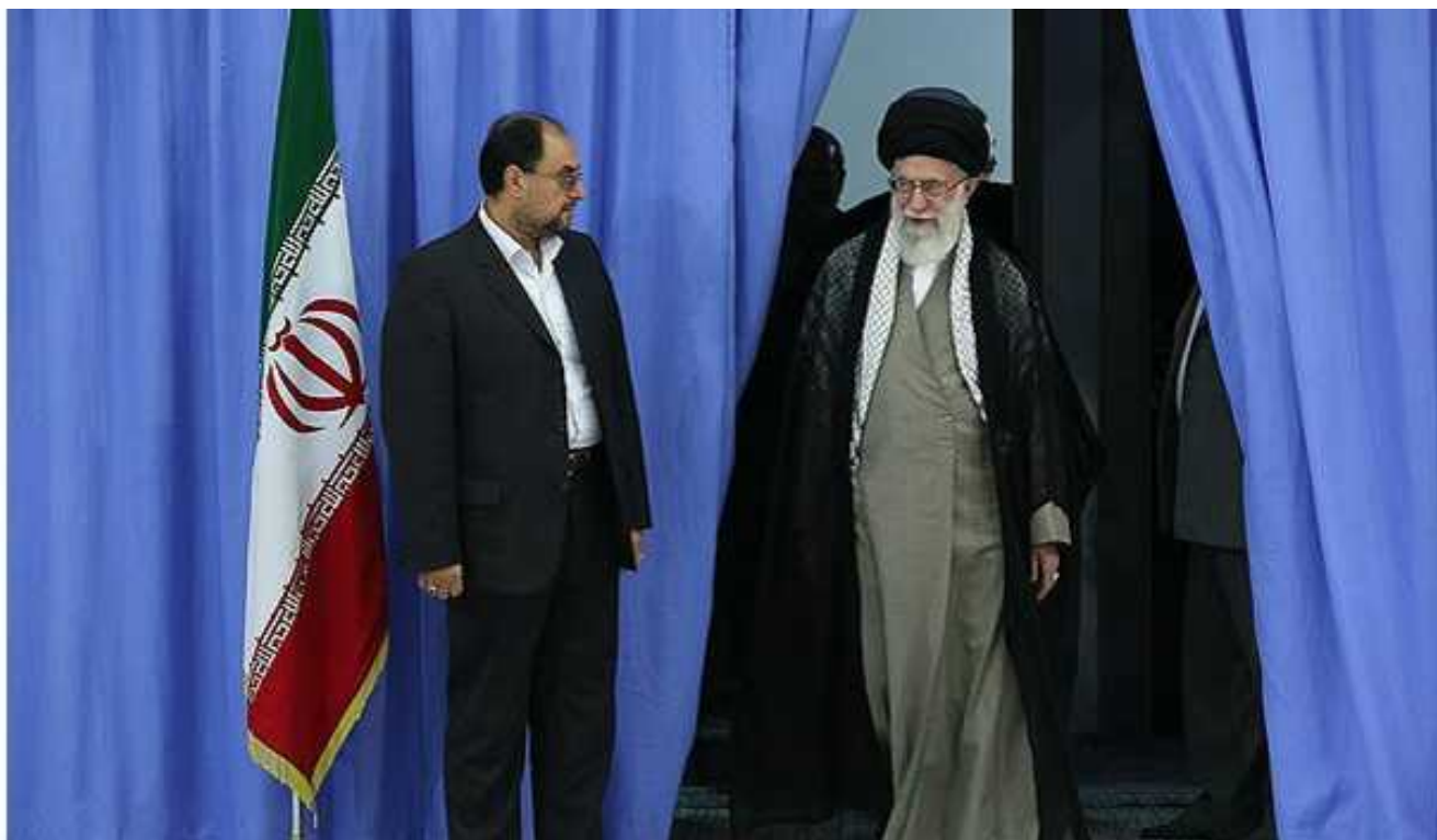
آیت الله علی خامنه ای رهبر ایران گفته علیرغم بدبینی به نتیجه مذاکره با آمریکا با این اقدام مخالف نیست

کتاب «ایران و آمریکا» نوشته حسین موسویان، به همراهی شهیر شهید ثالث اخیرا توسط انتشارات