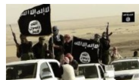
ادامه درگیری ارتش عراق و داعش در نزدیکی بغداد