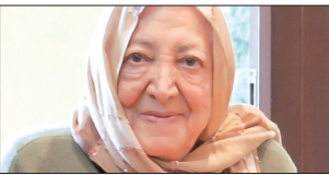
گفت و گو با مؤسس کهریزک