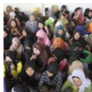
Maid in Saudi Arabia