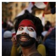
How Morsi, Brotherhood Lost Egypt