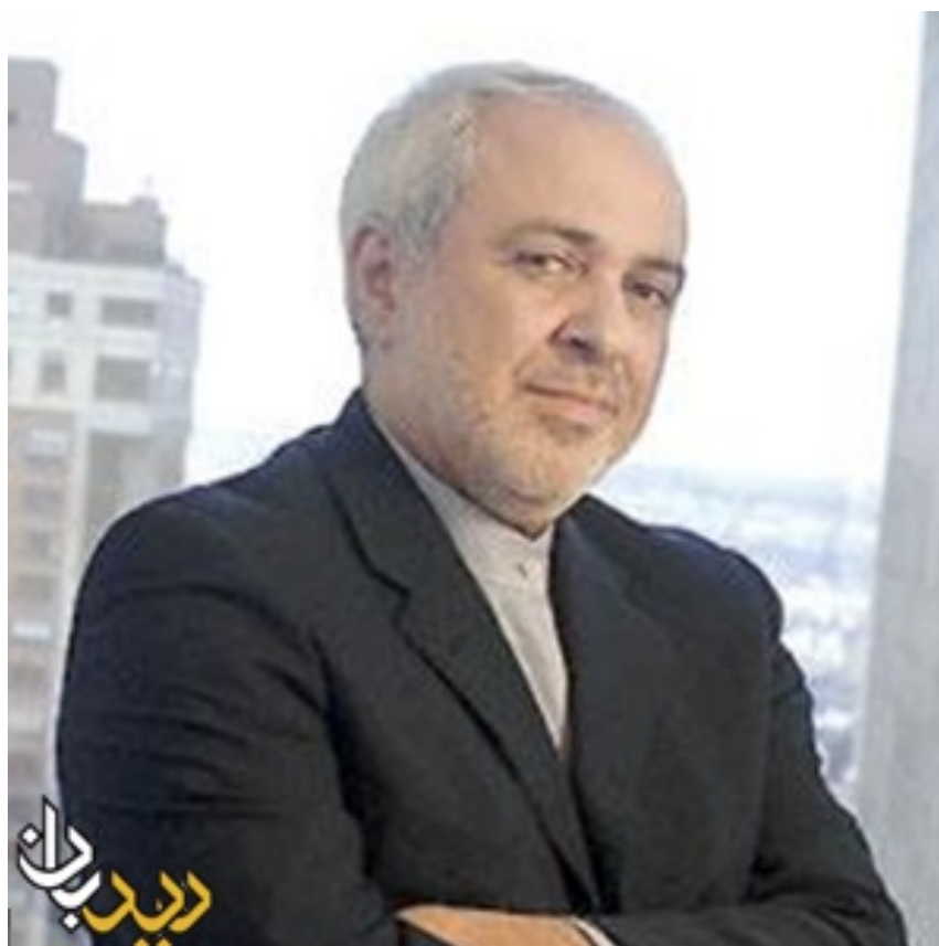
محمد جواد ظریف

ظریف نیز سفیر و نماینده دائم ایران در سازمان ملل متحد به مدت پنج سال بود و در حال حاضر دستیار ارشد وزیر خارجه است.