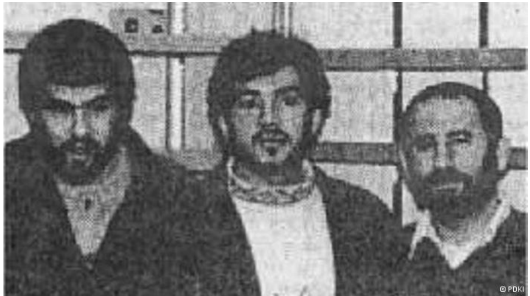
سه تن از عاملان ترور میکونوس که توسط پلیس آلمان دستگیر شدند

موسویان می‌گوید: «آقای بنی‌صدر که ۱۳۶۰ از ایران فرار کرده، او آمده بود در دادگاه برلین شهادت داده بود که حرف‌های این آقا درست است. آقای بنی‌صدری که بیست سال اصلاً در ایران نبوده بود، او آمده بود در دادگاه برلین شهادت داده بود که حرف‌های این فرد درست است.»