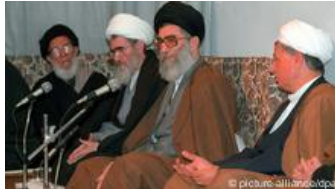
۲۰ سال پس از ترور میکونوس و محکومیت رهبران ایران 16.09.2012

بیست سال پیش، در ۱۷ سپتامبر ۱۹۹۲ چهار فعال سیاسی ایرانی در رستوران میکونوس برلین به قتل رسیدند. دادگاه رسیدگی به پرونده این ترور شماری از مسئولان ارتش جمهوری اسلامی را به عنوان آمران این جنایت مجرم شناخت.