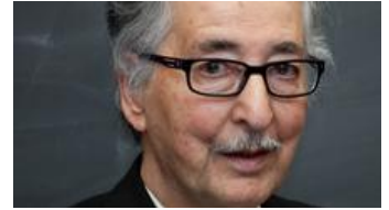
بازخوانی ترور میکونوس در گفت‌وگو با ابوالحسن بنی‌صدر

دادگاه رسیدگی به پرونده ترور میکونوس ۵ سال طول کشید. جنبه مهم و تاریخی رای دادگاه آن بود که برای نخستین بار مسئولان تراز اول یک نظام سیاسی را محکوم کرد. تأثیر این بخش از حکم دادگاه میکونوس چه بود؟