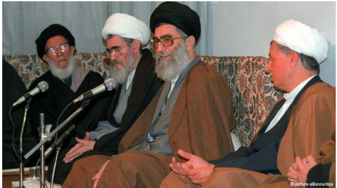
رهبران جمهوری اسلامی در مظان اتهام تروریسم دولتی