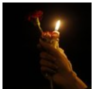
Two Prototypes of Arab Opposition