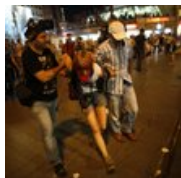
AKP May Have Gotten the Message From Gezi Park