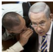
Netanyahu as the Prophet Jeremiah