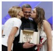
Tunisia's Revolution: Between Breasts And Beards